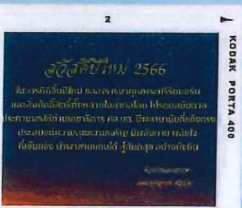
การ์ดอวยพรจากบุคลากร ศอ.บต. แต่ผู้บริหาร