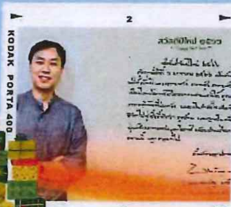
รองเลขาธิการ ศอ.บต. ส่งความปรารถนาดีด้วยการ์ดอวยพร