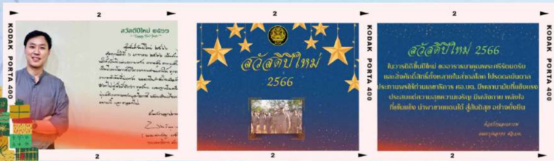
รองเลขาธิการ ศอ.บต. ส่งความปรารถนาดีด้วยการ์ดอวยพร